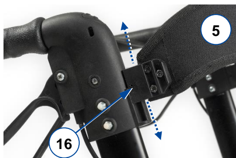
Figure 3 : insérer/retirer la ceinture de soutien dorsal

Pour la démonter, desserrez la vis et faites à nouveau coulisser la base jusqu'à ce que l'extrémité du soutien dorsal se déboîte.