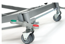
Frein central au pied ou 4 roulettes pivotantes freinées