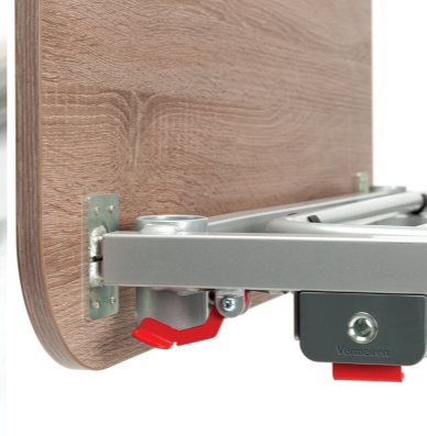
Système de verrouillage facile et rapide des panneaux et des barrières