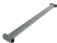
Rallonge (20 cm) pour la surface de couchage