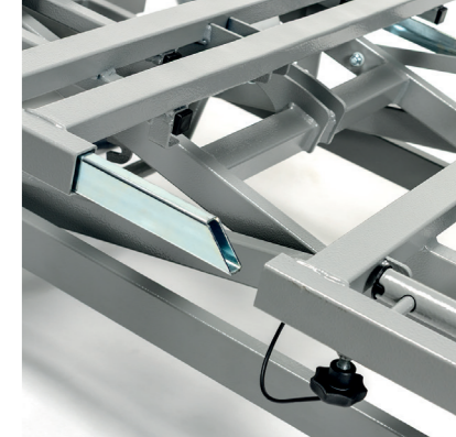
Démontage du châssis du lit sans outils