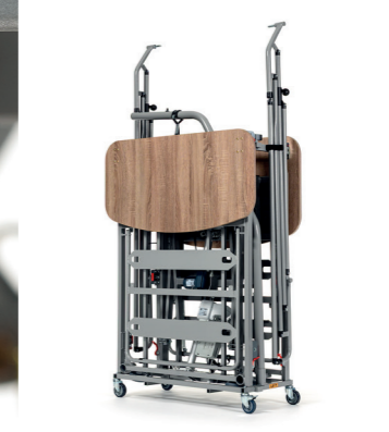
Kit de transport sur roues pour stockage facile