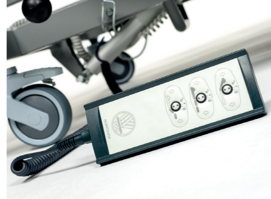
Télécommande simple et verrouillable