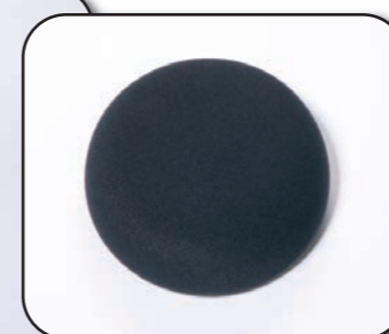
V40 Boutons gel protège-genou tournant (paire) 100x100 mm