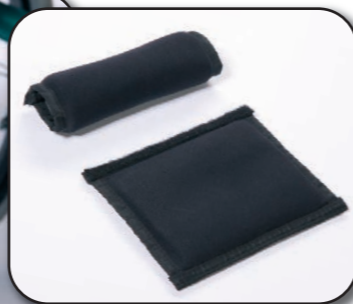
V12 - V14 Enveloppe protectrice gel pour tubes 6"-8" (paire) 120x160 mm - 120x200 mm