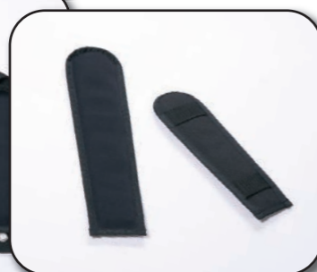
V20 Protection gel pour ceinture de sécurité (en 2 parties) 325x80 mm et 230x70 mm