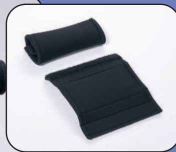
V18 Poignée gel pour béquille ou déambulateur avec velcro (paire) 120x130 mm