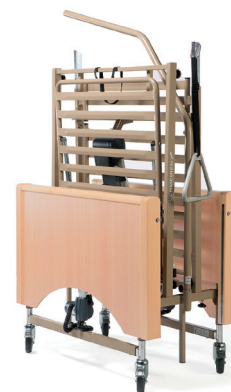
Livré sur Kit de transport