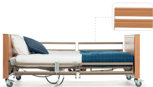
Demi-barrières (métal ou bois)