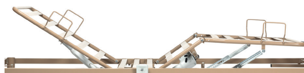
Lattes en métal