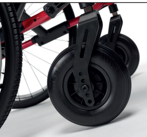
Hauteur d'assise réglable