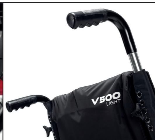
Poignées de pousser et dossier réglables en hauteur