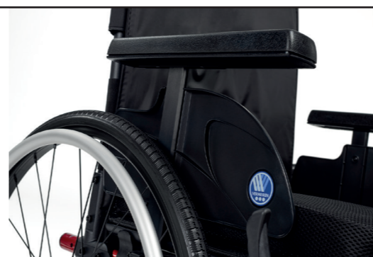
Accoudoirs amovibles sans outil

Étant de la famille V-série, le V500 Light offre une large gamme d'accessoires et d'options vous permettant de créer votre propre V500 Light selon vos besoins.