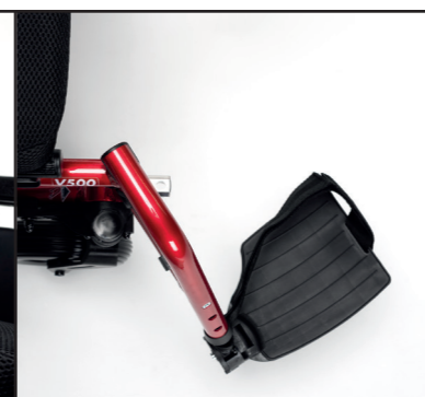
Repose-pieds escamotable intérieur extérieur Repose-pieds amovibles