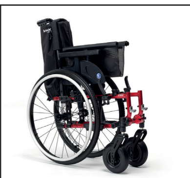
Fauteuil pliant pour un transport et rangement simplifiés