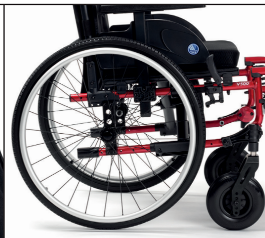
Angle d'assise réglable : 0° - 10°