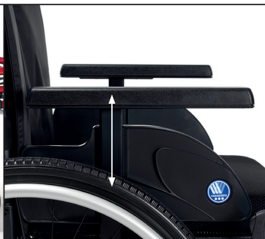
Manchettes d'accoudoirs réglable en hauteur et profondeur