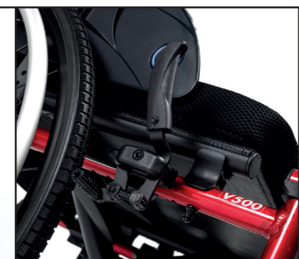
Leviers de frein pliants pour faciliter les transferts