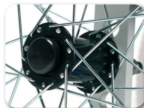
Roues Quick Release