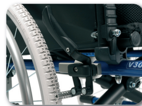
Prolongateurs de frein