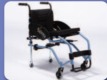
Roues de voyage B86