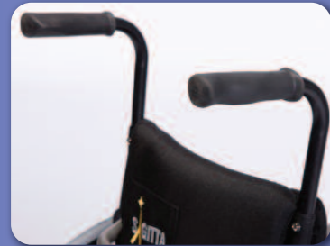
Poignées de poussée standard