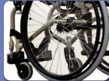
Protection rayons B85 (transparent)