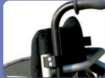
Poignées de poussée réglables en hauteur