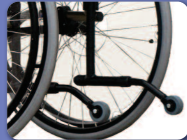
Paire de roulettes anti-bascule B78