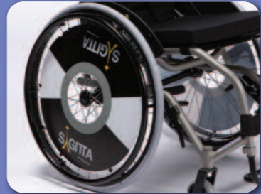
Protection rayons avec logo Sagitta B85