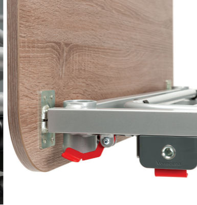
Système de verouillage facile et rapide des panneaux et des barrières