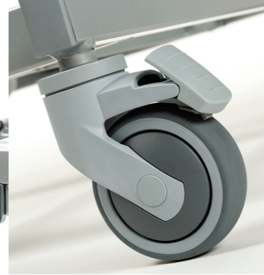
Roues de haute qualité avec frein