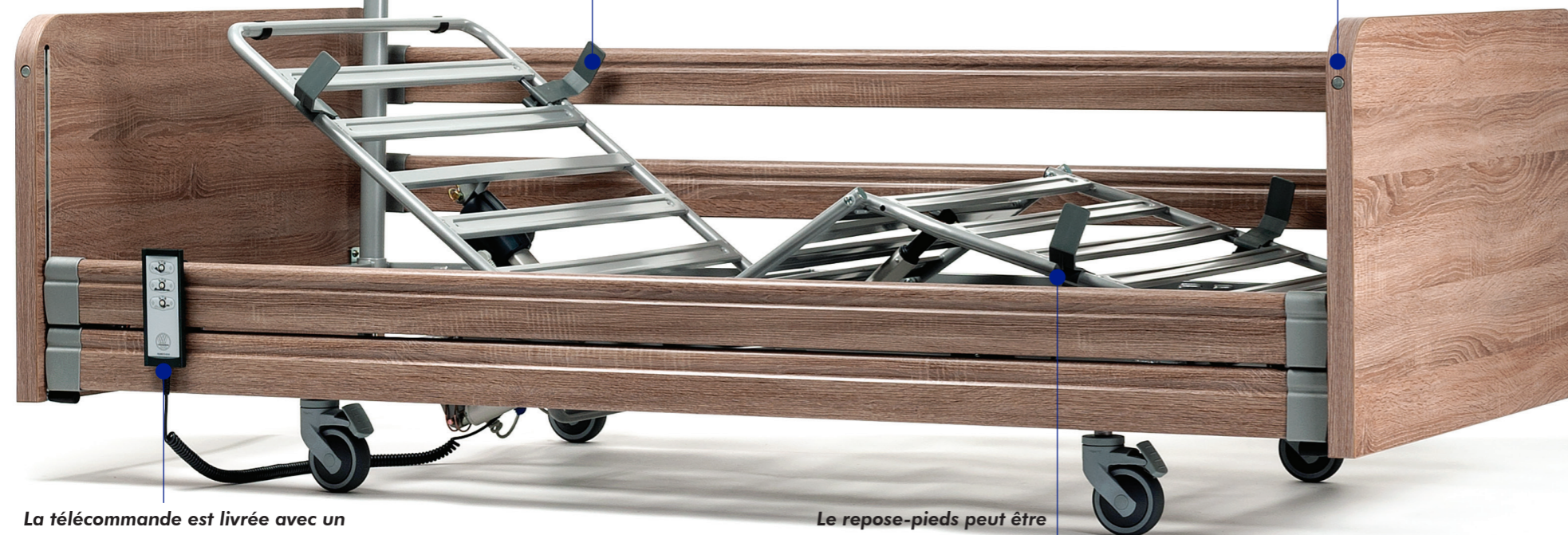
La télécommande est livrée avec un long câble pour pouvoir être accessible à n'importe quel endroit le lit.