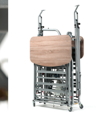
Kit de transport sur roues pour stockage facile