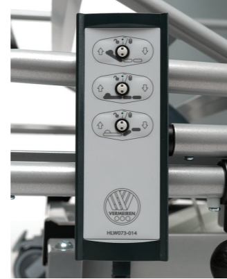
Télécommande simple et verrouillable