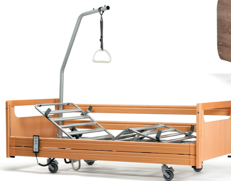
4 arrêts de matelas (2 côté tête et 2 côté pieds) pour conserver le matelas en place.