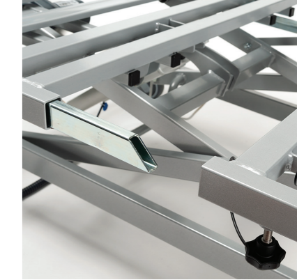
Démontage du châssis du lit sans outils